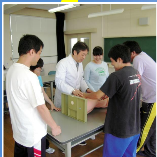
人体模型を使った解剖学授業